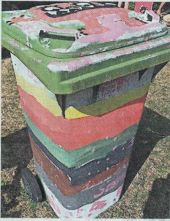
Eine Kreation mit bunten Streifen.