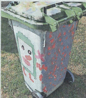
Das Müllmännchen grüßt.