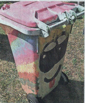
Tonnennutzer ernten ein Lächeln.